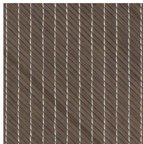
б - многонаправленное