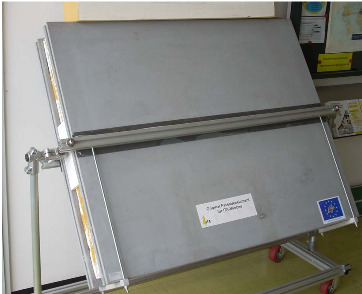
Рисунок 4. Стеновая панель, в которой ограждающими наружными и внутренними слоями являются тонкостенные текстильно-армированные бетонные плиты (сэндвич-панель)

эффект, который удерживает нити на месте и предотвращает их от расширения. Поэтому проницаемость матрицы в полотно, особенно между филаментами, зависит от природы соединений в полотне и результирующего затягивающего эффекта, структуры полотна, количества филаментов в нити и технологического процесса. Изготовление бетонных композитов, армированных текстильными полотнами, должно гарантировать хорошую проницаемость частиц бетона в полотне. При использовании текстильной арматуры, возможно интегрировать элементы, которые гарантируют правильное расположение текстиля внутри бетонного элемента.