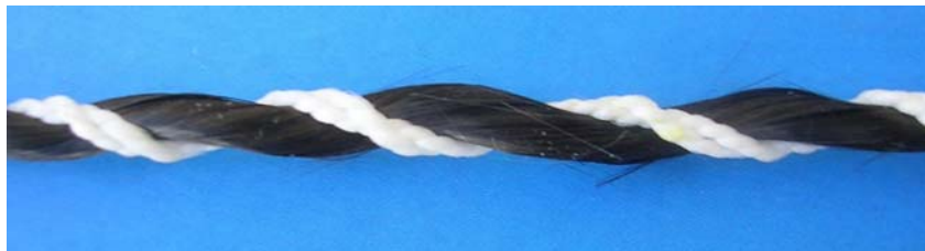
Рисунок 2. Создание периодического профиля

Наряду с волокнами при армировании бетона широко используются различные типы текстильных нитей. При этом необходимо учитывать сцепление текстильной арматуры с бетоном, потому что это влияние чрезвычайно важно для несущей способности конструктивных элементов. Сцепление текстиля с бетоном может быть улучшено за счет разнообразных структур нитей. Обычно текстильная арматура состоит из филаментных непрерывных нитей. При помощи изменения поверхности нити может быть улучшено ее сцепление с бетоном. Структуры нитей, применяемых для армирования бетона, включают оплетенные и обкрученные нити, которые улучшают сцепление с бетонной матрицей. Это воспроизводит структуру, схожую со стальной арматурой периодического профиля (рис. 2). При использовании технологии фрикционного прядения армирующая нить покрывается оболочкой, при этом создается структура нити с сердечником. В качестве сердечника обычно используются стеклянные, арамидные и другие высокопрочные нити. Оплетка состоит, например, из полипропиленовых штапельированных волокон, которые оплетают сердечник во время процесса прядения. При данной технологии создается рыхлая поверхность, которая улучшает сцепление с бетоном.