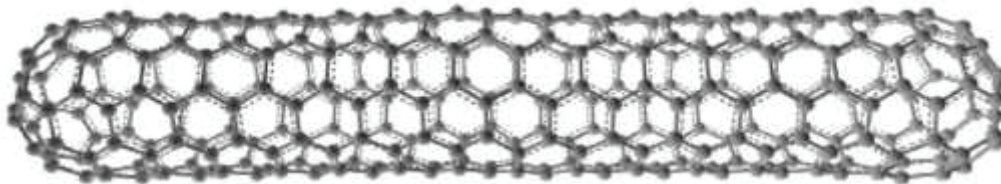
Рисунок 3. Структура нанотрубки