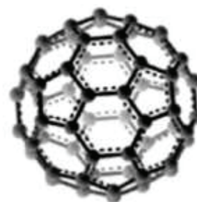
Рисунок 1. Структура фуллерена

Фуллерены являются веществами, хотя и высокоэффективными как упрочнители цементных материалов, однако очень дорогими и поэтому в широкой практике не используются.