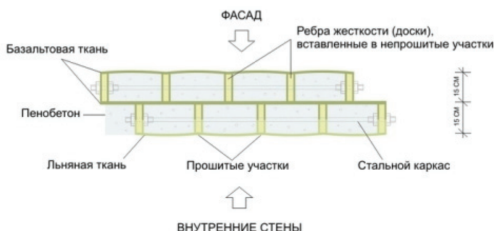
Рисунок 2. Конструкция тканевой несъемной опалубки, заполненной бетоном

Текстбетон имеет двойную конструкцию (рис. 2). В пазы оболочки текстопалубки вставляются ребра жесткости - деревянные доски 4000×150×50 мм. На концах досок отверстия 55 мм, в которые вставляются стальные трубы диаметром 45 мм с резьбой на концах для растягивающих гаек. В трубах высверливаются отверстия диаметром 12 мм через 250 мм для подачи легкого бетона, т.е. они используются в качестве трубопроводной системы для бетонирования.