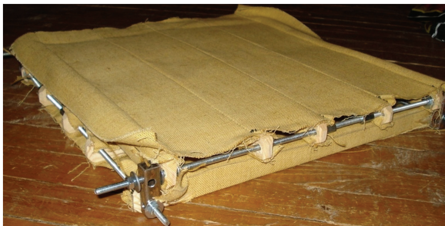
Рисунок 1. Макет текстопалубки 5000*4000*300 мм

Текстбетон – это искусственный камень строительного назначения, содержащий на внешней поверхности армирующую мелкосетчатую оболочку с многофункциональными свойствами, образованную переплетёнными нитями жизнестойкого несъёмного опалубочного текстильного материала, адгезированного вяжущим веществом. На рис. 1 представлена фотография макета текстопалубки.