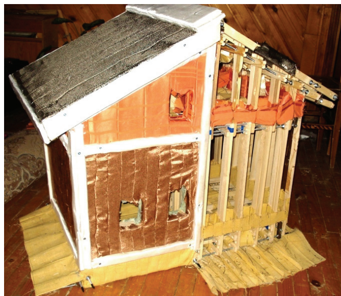
Рисунок 5. Макет пустотелого каркаса одноэтажного здания с мансардным этажом площадью 80м 2

К трубам шарнирных соединений подсоединяются трубные выпуски, которые выводятся под текстопалубку под отсыпку здания. Таким образом, создаётся трубная система для заполнения пустотелого каркаса здания легкобетонными смесями. В смонтированном каркасе здания прокладываются все инженерные сети, устанавливаются оконные и дверные блоки. После полной сборки конструкции тканевые выпуски обшиваются портативными мешкосшивальными машинками или степлером. Далее крепятся плинтусы, карнизы и внешние накладные элементы, которые дополнительно повышают прочность герметизирующих швов. Макет одноэтажного дома с мансардным этажом представлен на рис. 5.