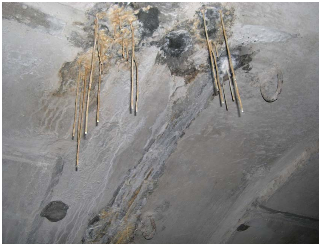
Рисунок 1. Образование сталактитов на внутренней стороне обделки тоннеля