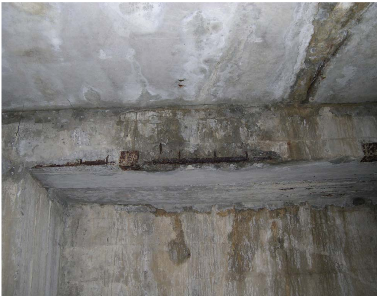
Рисунок 5. Откол защитного слоя бетона отделки в результате коррозии арматуры

Обнажившаяся масса корродировавшего металла имеет достаточно рыхлую структуру. Через неё к поверхности арматуры поступает кислород воздуха, являющийся сильнейшим окислителем, и влага, содержащаяся в воздухе и мигрирующая по порам и трещинам бетона отделки. В результате процесс коррозии металла ускоряется.