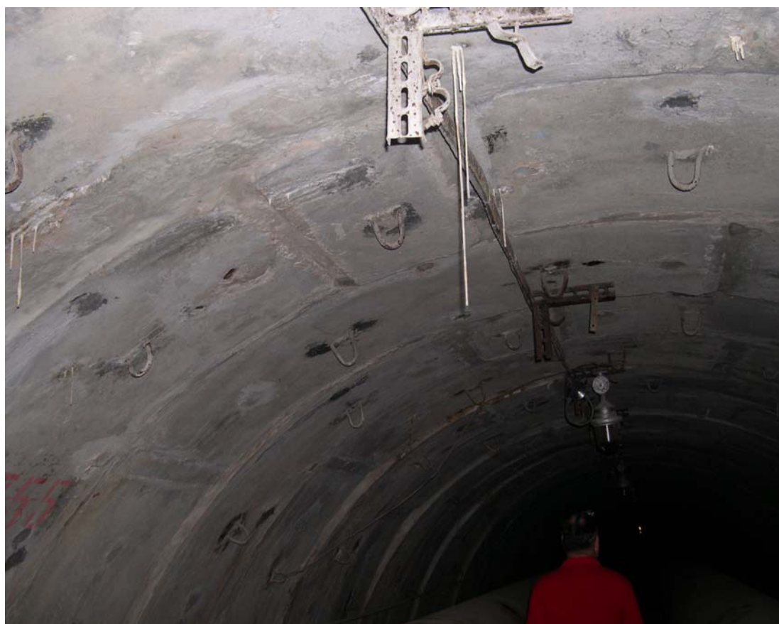
Рисунок 2. Размер сталактита достигает 500мм