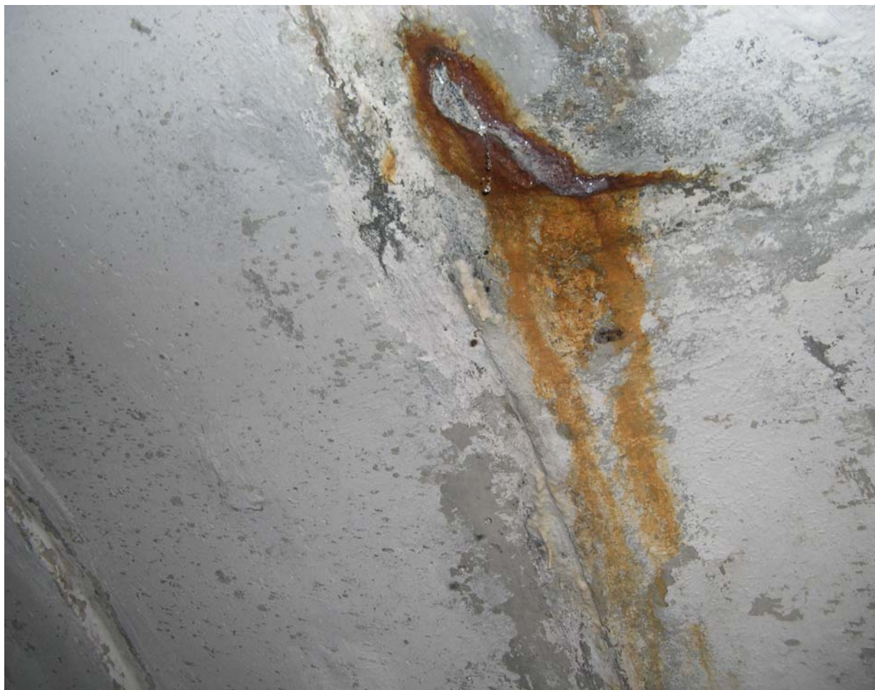
Рисунок 3. Свободное проникновение воды сквозь обделку тоннеля

Просачивание воды через стыки между блоками обделки – наиболее частый случай. Оценочно около 90% случаев. В остальных случаях вода проникает через другие «слабые» места. Согласно данным лабораторного анализа, вода пресная. Эта вода, проходя через толщу бетона, растворяет составляющие материала бетона. Таким образом, происходит коррозия бетона по первому виду, описанному теорией, разработанной проф. В.М. Москвиным.