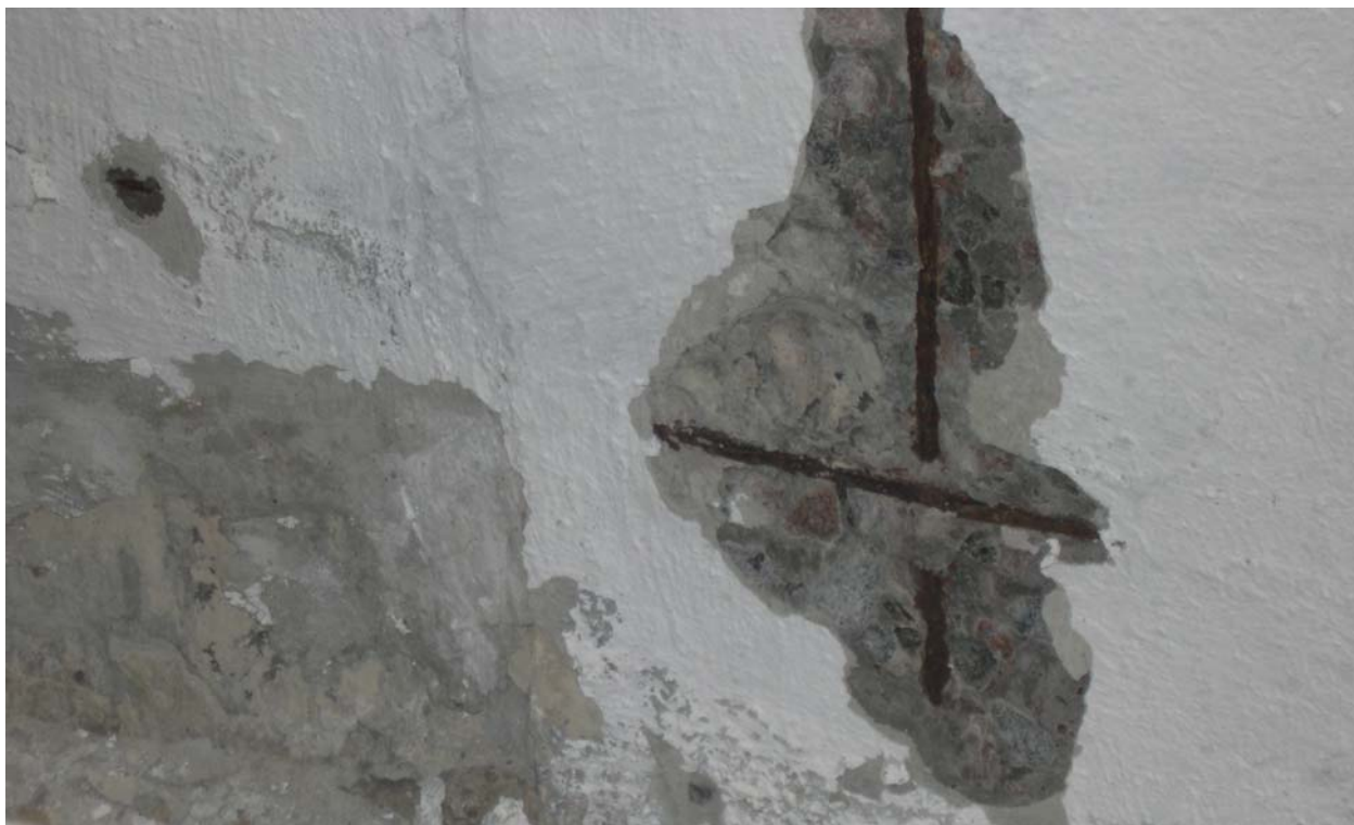
Рисунок 4. Откол защитного слоя бетона обделки в результате коррозии арматуры

т.е. ржавчину. Кроме того, железо вступает в химические реакции с иными соединениями, растворёнными в воде. Все эти вещества обладают объёмом, превышающим объём исходных материалов. Это приводит к нарастанию внутреннего давления в теле бетона и, как результат, к разрушению (отколу) защитного слоя бетона (рис. 4, 5).